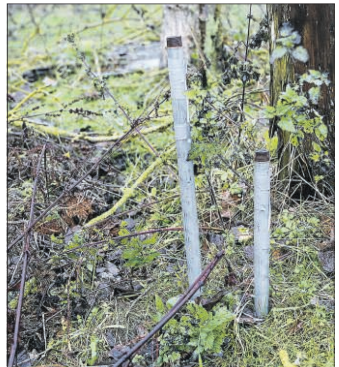
Ved hjælp af rørene kan man måle vandstand og -kvalitet.

flere lodsejere ved siden af hinanden har lyst til at have kvæget gående, så der kan laves et fælles hegn og sættes låger op. Samtidig vil kommunen tilbyde mini-kurser i at slå med le, så man