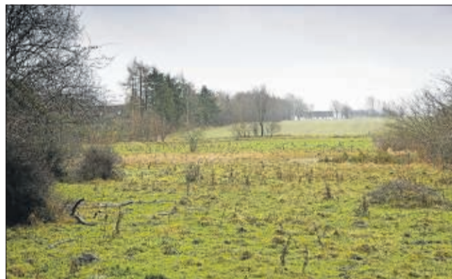
Ved de sjældne rigkær skal kvæg hjælpe med at afgræsse vegetationen.

- Kalken i mosen stammer fra den tid, hvor moserne var store vådområder med søer efter sidste istid og her dannede alger den kalk, som