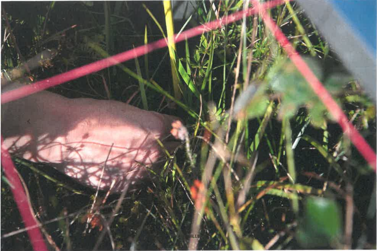
GPS bliver også brugt, så man fremadrettet kan finde det samme lille punkt.