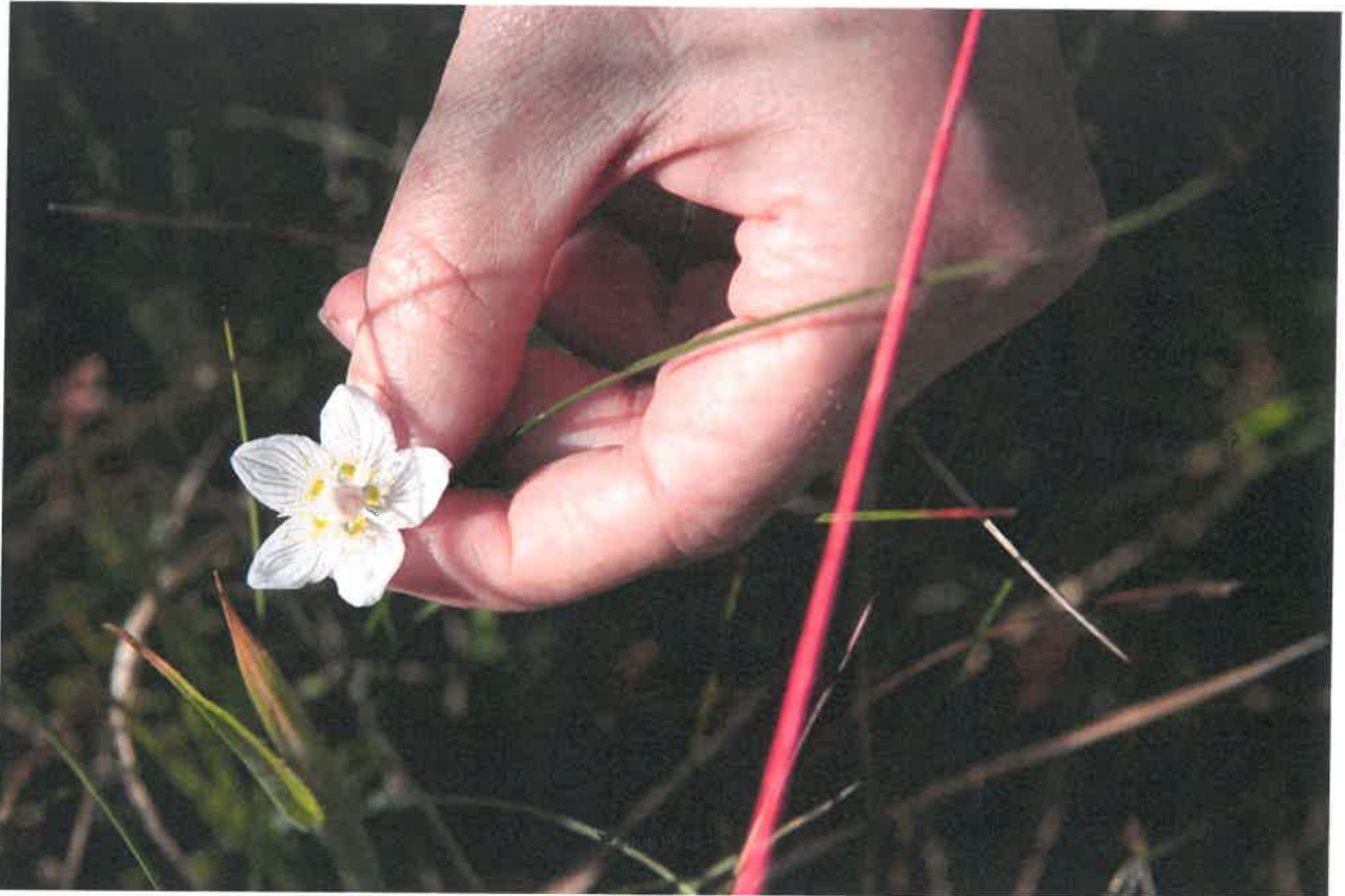
Leverurt, som hører til en af de sjældne planter, trives kun, hvis den står i et område, som har det godt.