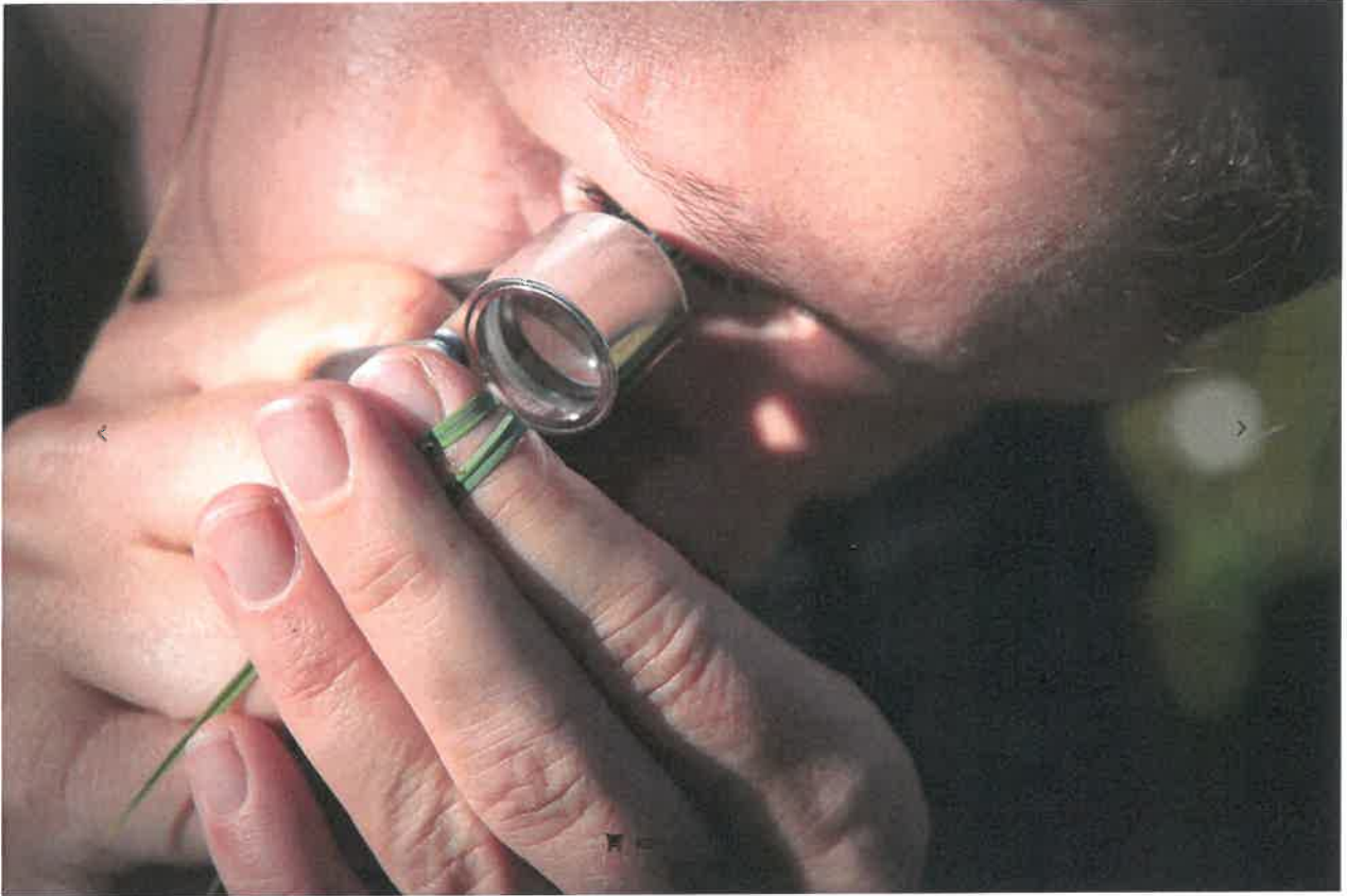
Projektet, hvor sjældenhederne sættes under lup, er en del af Riggilde LIFE, som er en form for naturovervågning.