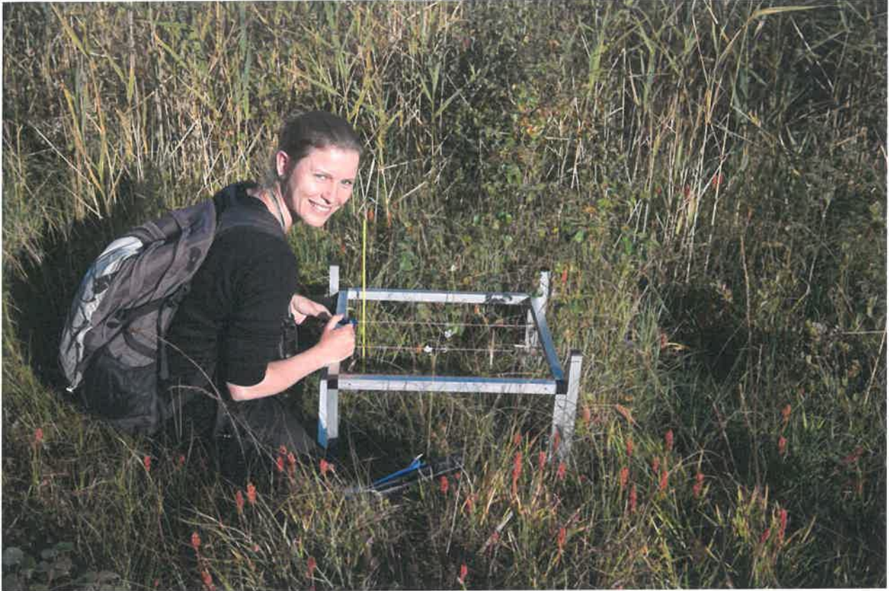
Registreringen foregår ved hjælp af en pinpoint-metode, hvor et lille stativ sættes op. Det som ligger indenfor bliver registreret.