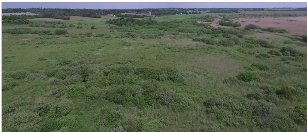
Figur 2-4 Dronefoto som tydelig viser den markante tilgroning af rigkærene.

Behandling af pleje og drift er ikke en del af hydrologiprojektet, men reetablering af naturlig hydrologi er ikke tilstrækkeligt til at genskabe den ønskede naturtilstand, såfremt områderne gror til i pil og tagrør. Overgange over de nye, tværgående grøfter er derfor nødvendige for at sikre adgang, og de vil forbedre mulighederne for afgræsning.