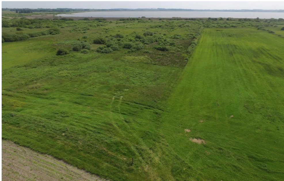
Figur 2-1 Dronefotos taget mod syd over projektområdet ved Langvad

I juni 2017 blev projektområdet gennemgået på ny. En række observationer af særligt karakteristiske arter blev indtastet på Fugleognatur på de to lokaliteter "Pedershøj" (v. Langvad) og "Tømmerby" (mod øst) som supplement til de mange eksisterende data fra området.