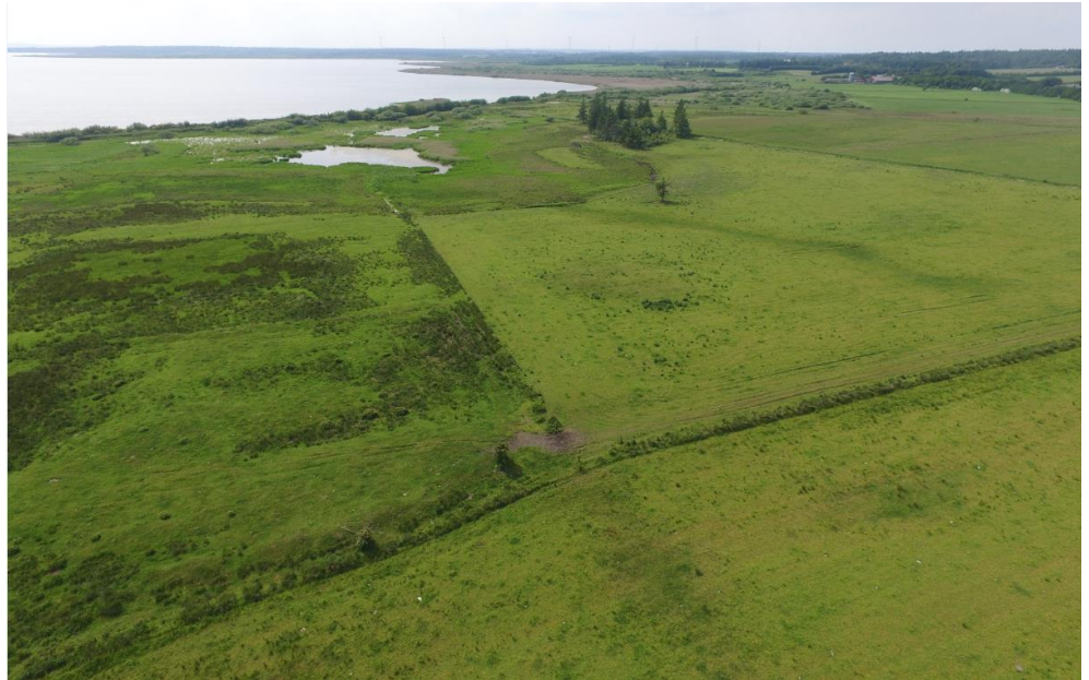
Figur 2-2 Dronefoto af den østlige del af projektområdet ved Tømmerby. Taget mod vest.

Desuden er der taget en lang række fotos til dokumentation, og området er overfløjet med drone.