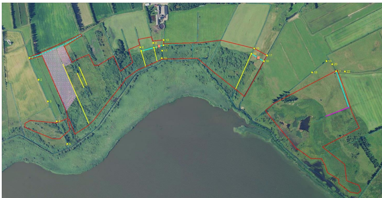
Figur 2-5 Supplerende opmåling april 2017

Vi har lavet supplerende opmåling af grøfter som vist på Figur 2-5. Opmålingerne er foretaget, hvor der er planlagt nye grøfter og dræn for at sikre afvanding fra områder uden for projektafgrænsningen. De opmålte koter kan ses i vedlagte fil: Grøfteopmåling_06042017.xlsx .