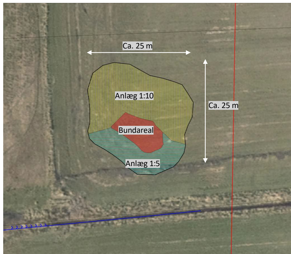
Figur 1: Etablering af vandhul på matr.nr. 32aa, Øsløs By, Øsløs.

Tilbudsprisen skal indeholde alle udgifter til opgravning og transport af jorden til opfyldningen, mens selve opfyldningen afregnes under posten for tiltag 2.7.1. Bemærk, at der skal ske fraktionering af det afgravede materiale, således afgravede muldjord indbygges nederst i opfyldningen.