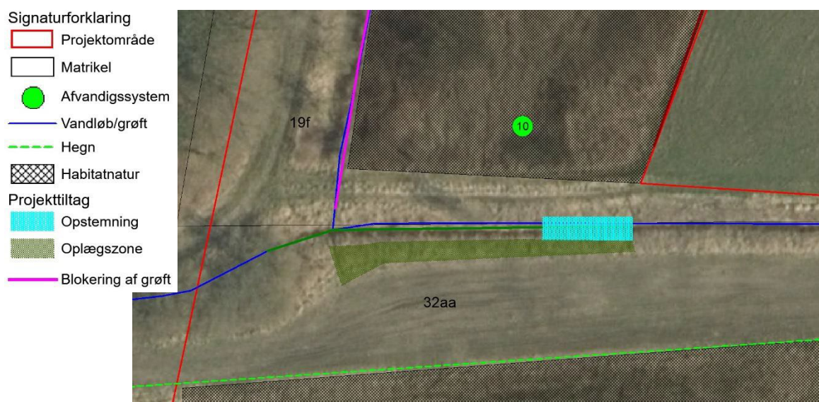
Figur 3: Terrassering af vandløb ved afvandingsystem 10.